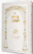
עלעגאנטע הארעע דעקל "כמו לעדר" באד מיט "אלאז סטעמסינג"